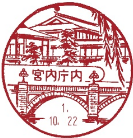
皇居・宮殿 (宮内庁内郵便局)