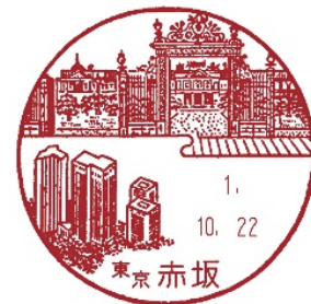
赤坂御所 (赤坂郵便局)

祝賀パレード御出発の皇居・宮殿から、国会議事堂、赤坂見附を經由して、御到着の赤坂御所までの風景印(全4局)の記念押印サービスを実施します。