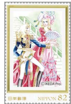
▲82円フレーム切手 (1種類) オスカル&アントワネット