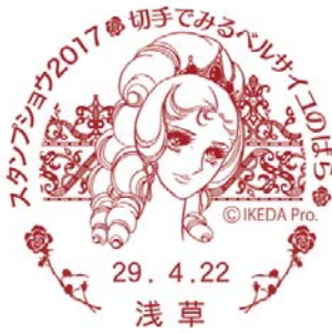
4月22日(土) マリー・アントワネット [22日限定使用]