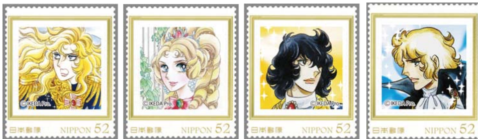
▲52円フレーム切手(4種類) 左からオスカル、マリー・アントワネット、アンドレ、フェルゼン

「ベルサイユのばら」のキャラクターがデザインされたオリジナルフレーム切手(5種類)が会場で限定販売されます。