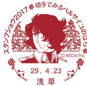
4月23日(日) アンドレ [23日限定使用]

会場内の浅草郵便局臨時出張所では、「ベルばら」公式記念消印の押印サービスを実施します。また、隅田川に架かる橋の描かれている風景印8郵便局(千住河原、本所吾妻橋駅前、鳥越神社前、墨田太平町、両国、深川、中央新川、中央築地六)の集中押印サービスを実施します。押印には、52円以上の切手貼付が必要です。