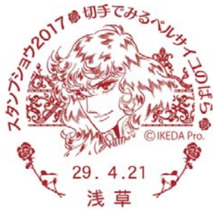
4月21日(金) オスカル [21日限定使用]