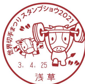
4月25日(日) [当日限定使用]