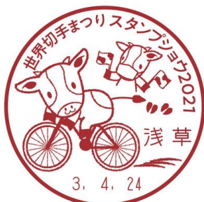
4月24日(土) [当日限定使用]