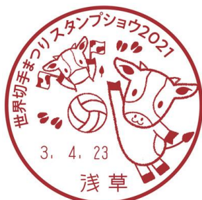
4月23日(金) [当日限定使用]