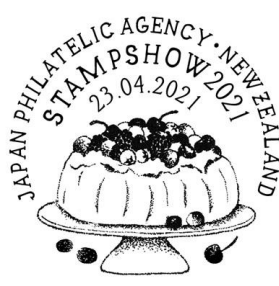
ニュージーランド郵政