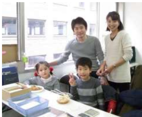
家族連れで切手市場に出店する切手コレクター

イベントには切手ショップが出張してきている場合、切手コレクターが重複品を持ってきている場合があります。時には慈善団体が回収した使用済切手を販売している場合もあります。