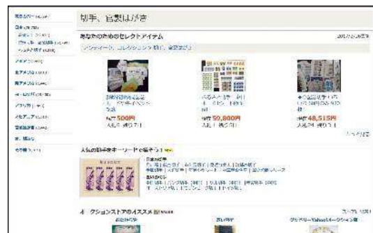
「ヤフオク」の「切手」カテゴリ