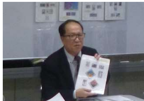
上：今月入手した切手を解説しているところ。 左：盆回しと呼ばれる大規模な切手交換の様子。