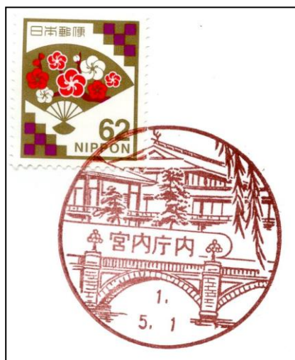
図14. 風景印(宮内庁内) 額面62円の慶事用切手を貼付

小型印 (こがたいん) : 小型記念通信日付印の略称で、地方的な記念行事等で使われる記念印(図15)。直径32mmの絵入りゴム印で、印色はトビ色。使用期間は短く、通常1日～1週間程度。この小型印は日本郵趣協会主催の研究発表会(ミニペックス)や「切手の博物館」のイベントでも使用されることがあり、押印サービスも行われる。