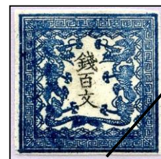
図3. 竜切手 百文

手彫切手(てぼりきって) ：明治初期の切手。銅版に手作業で図柄を彫るエッチング法(凹版印刷の一種)を使用(図3)。手彫り切手は竜切手、桜切手、鳥切手、改色桜切手の4グループに大別される。