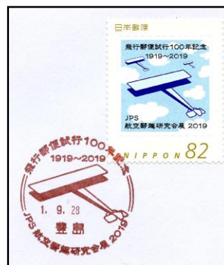
図15. 小型印 (飛行郵便試行100年記念) 額面82円のフレーム切手を貼付