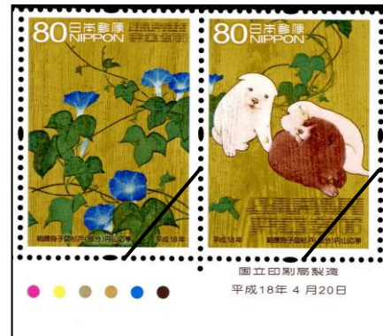
図 10. 銘版(右下) カラー・マーク(左下)

紙付 (かみつき) : 切手が貼付された封筒や私製はがきなどの郵便物の多くは紙で作られている。貼付された切手を封筒等に付けたままで切り取られた状態の切手。