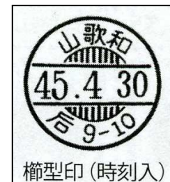
図 11. 楕形印

機械印 (きかいいん) : 機械日付印のことで、自動押印機で使用される郵便印。基本的には、切手の図柄を消す波型部分と、局名や日付を表示する円形部分とからなる。使用目的等により、標語印、広告入り印、年賀印、選挙印等がある。