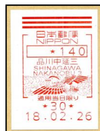
図 13. メータースタンプ

メータースタンプ : 郵便料金計器で押される印影と、郵便局設置の証紙自動発行機による郵便料金証紙のこと(図13)。ともに切手と日付印の機能をもち、料金額、局名、日付等が表示される。