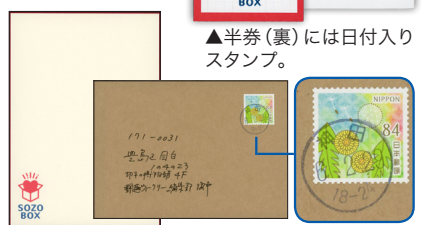
▲半券(裏)には日付入りスタンプ。

2月29日のオープン初日、秋葉原のSOZO BOX (YW10号「役に立たない情報」)に行ってきました。購入した本をその場でラッピングして送ることができる店で、手紙だけの利用もOK。私は「オリジナルレターセット」(1通150円・別途お紙サービス料が1通につき+150円)をお手紙購入し、店内のポストから差し出しました。店内には日本地図のパネルがあり、スタッフから「送り先の地域にぶら下げてください」と紙の札を渡されました。札の半券には日付入りスタンプが押されており、初日訪問の良い記念に! 文房具は使い放題で、コーヒーのサービスもありました。(辰年男・東京都)