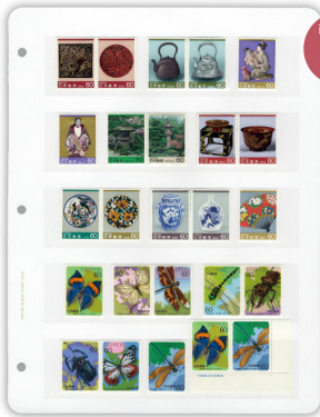
商品番号 1005 5段 【収納例】中世の記念・特殊切手やふるさと切手、普通切手の耳紙付きコーナーなどの収納に最適。