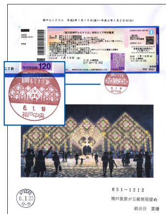
▲有料エリアの入場券を貼付したカバー(小型印)。