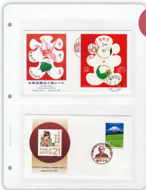
商品番号 1002 2段 【収納例】初日カバーや封筒、小型シート、絵入りはがきなどの収納に最適。