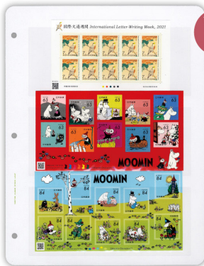
商品番号 1003 3段 【収納例】小型シートや、記念・特殊切手の田型、ブロック、ペーパーなどの収納に最適。