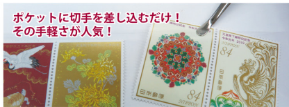
ポケットに切手を差し込むだけ! その手軽さが人気!

※本紙「郵趣ウィークリー」のご購読に関するお問い合わせは、日本郵趣協会TEL03-5951-3311へご連絡ください。