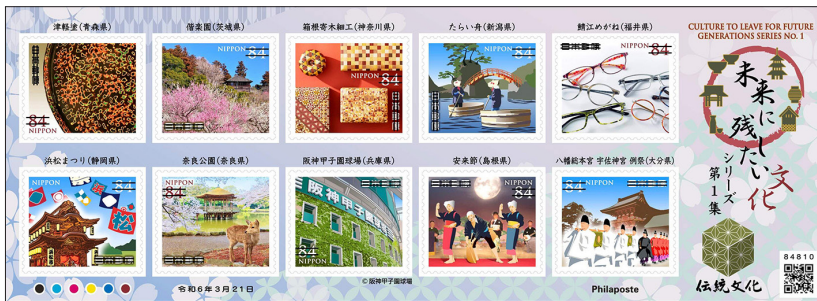
「未来に残したい文化シリーズ」第1集

津軽塗は青森県の津軽地方で作られる伝統漆器。弘前市を中心に製作・販売されているので、弘前局の風景印を