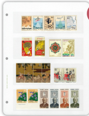
商品番号 1004 4段 【収納例】記念・特殊切手のペーパーやストリップ、普通切手の田型、大型サイズの記念・特殊切手などの収納に最適。