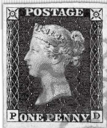
世界最初の切手・ペニーブラック。 『イギリス普通切手図鑑 戦前編』より

編集部おススメ！話題の新切手から⑬ ..... 49 ワールド スタンプ ナウ ⑬ [榎山 哲太郎] “ダイバーシティ”って何？ ..... 50 『ビジュアル版』(図版ページ) ..... 52 『テキスト版』(解説ページ) ..... 65