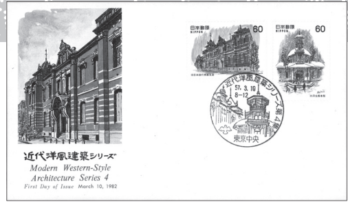
近代洋風建築シリーズ Modern Western-Style Architecture Series 4 First Day of Issue March 10, 1982

「近代洋風建築シリーズ」第4集のFDC。旧日本銀行京都支店(現・京都文化博物館別館)は辰野金吾と弟子の長野宇平治による設計。【カラー特集「近代洋風建築シリーズ」を楽しむ!より】