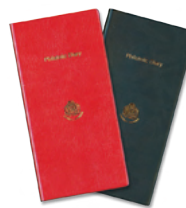
▲郵趣手帳の見本 赤が維持会員、黒が正会員。