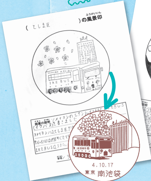
優秀作品が風景印として 郵便局で採用されました！