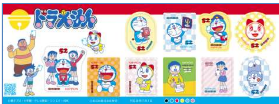
ドラえもののグリーティング切手(2016年)

郵便切手には、発行枚数が決められた記念特殊切手と、需要に応じて印刷する普通切手とがあります。1995年からは季節の行事のあいさつなどに使えるグリーティング切手という中間的な性格を持つ切手も発行されています。