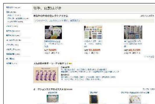
「ヤフオク」の「切手」カテゴリ