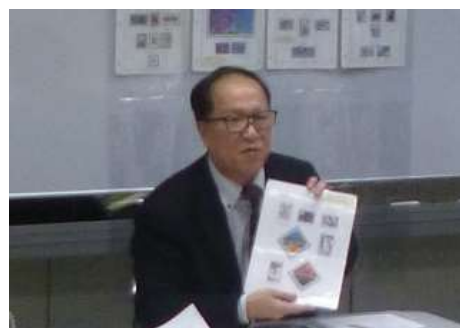
上: 今月入手した切手を解説しているところ。 左: 盆回しと呼ばれる大規模な切手交換の様子。