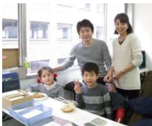
家族連れで切手市場に出店する切手コレクター

イベントごとの趣旨や、それぞれのブースの性格を見極めて賢く切手を手に入れましょう。