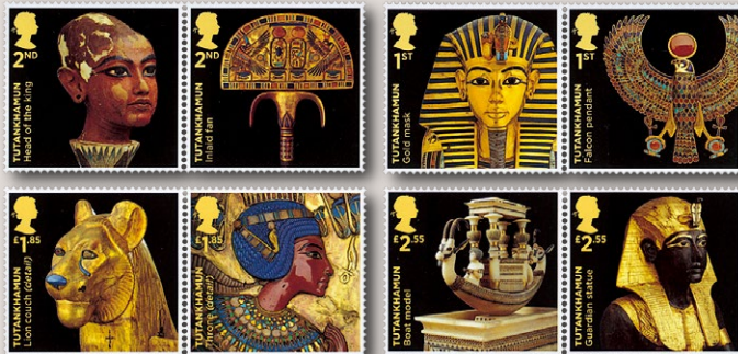
2022年イギリス発行「ツタンカーメンの宝物」。[60%]