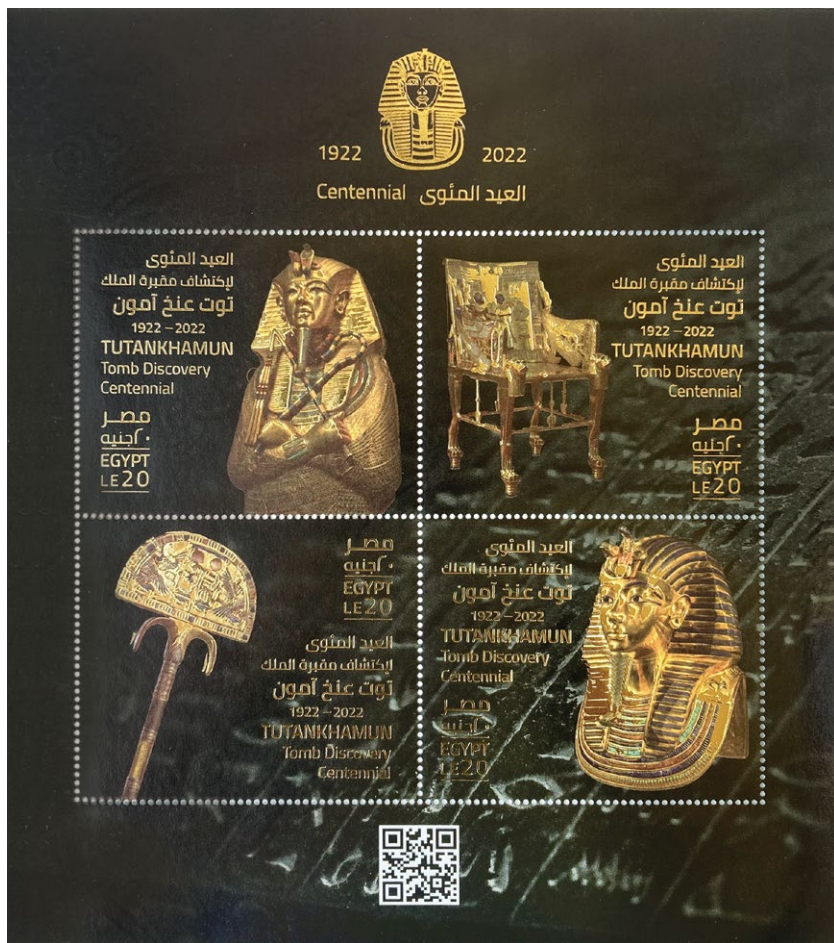
左上から第3の人型棺、玉座、大扇、黄金のマスク。一部を金色で箔押し。[75%]

エジプトから発行された連刷シートには、黄金のマスクをはじめ、ツタンカーメンのミイラが納められていた純金製の第3の人型棺、木製金張りの玉座、大扇といった出土品のうちの逸品が、金色箔をふんだんに用いて描かれています。